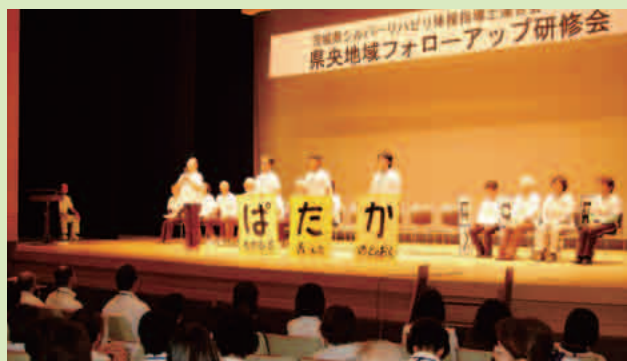
パネルを使って嚥下体操