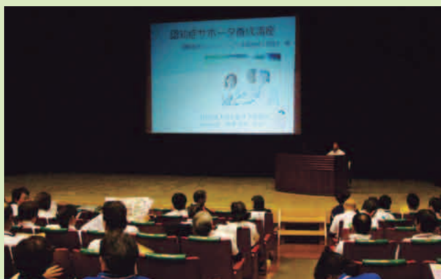
「認知症」の基調講演風景

第2部として、各指導士会から研修委員2名ずつの計20名でシルリ八体操指導を行い、15時30分閉会しました。