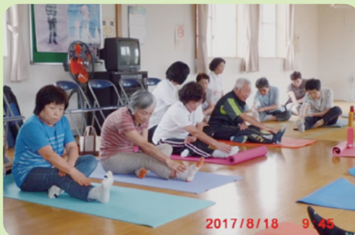
新教室で体操に励む参加者の皆さん

今後とも行政との二人三脚の連携をより強固にして、住民のニーズに応えられるよう努力していきたいと決意を新たにしています。