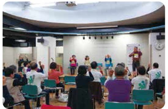
2級指導士養成講習会の様子

投票者の意見として、「高齢化が進み、認知症予防や健康寿命を延命し、元気に過ごしていくために、この体操が続いて行くこと、指導士が増えていくことを願います。」「茨城の宝として広げて欲しい」などとありました。また、選出された理由のひとつとして、シルバーリハビリ体操をさらに発展させていく使命があると選考委員会では説明しています。