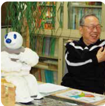
二代目ロボット「たいそう」